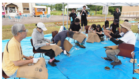
▲昨年度の石器づくりセミナーの様子