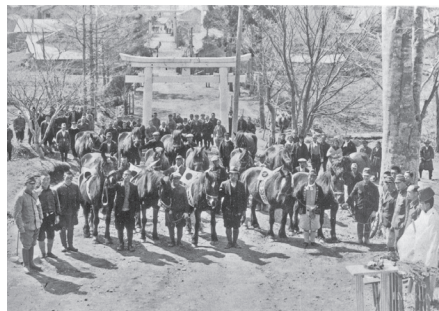
▲今金八幡宮前で行われた出征馬壮行会のような（昭和13年撮影）人だけでなく馬も数多く戦地へ送られました

なお、寄贈資料については美利河地区の文化財保管・活用庫で大切に保管するとともに、学校教育等での活用も予定しています。