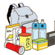
食料・飲料等の非常用品の備蓄