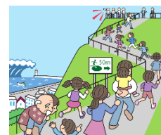
防災訓練への参加