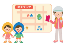
避難場所・避難経路等の確認