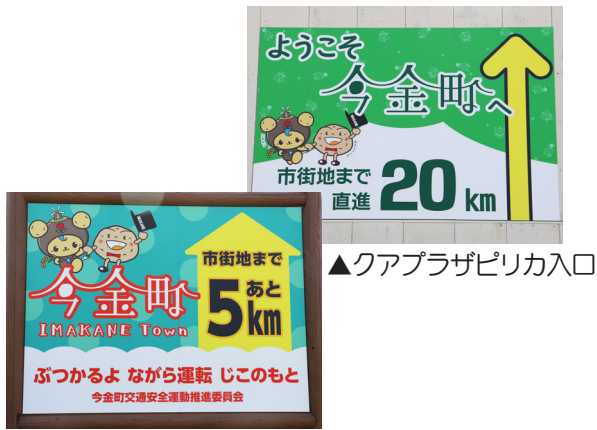
▲クアプラザピリカ入口

また、種川構造改善センター横の看板は、通行するドライバーへ交通安全の啓発として、無事故の呼びかけをしています。