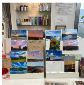
▲販売中のポストカード