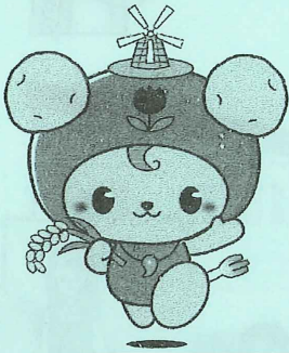
今金町マスコットキャラクター いまりん