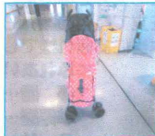
ベビーカーカバー