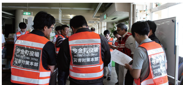
▲広報車巡回の打合せ

その後、対策本部会議で広報車による周知、自主避難所の開設などの体制が決定され、職員配置を行い対応にあたりました。