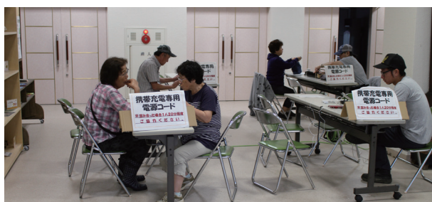
▲避難所充電コーナー