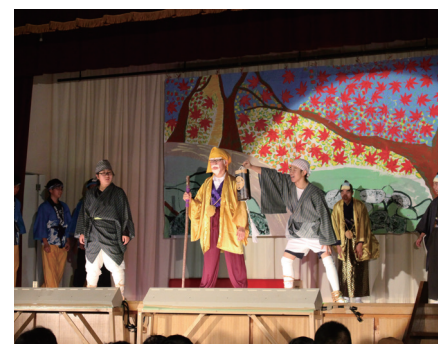
▲ 11月18日 今金高等養護学校 学校祭