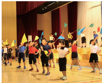
▲ 10月14日 今金小学校 学習発表会

9月30日の今金中学校文化祭を皮切りに町内の各学校の学習発表会や文化祭が行われました。