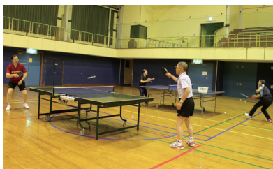
▲活動中のみなさん

今回は、今金町体育連盟に加盟する今金町卓球連盟について紹介します。同連盟は、昭和42年に愛好会として発足し、昭和53年に今金町卓球連盟に名称変更し、活動を行っています。