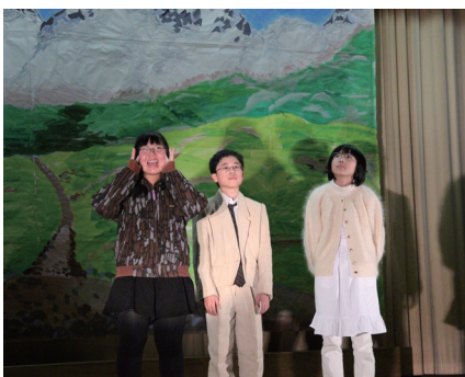
▲ 11月11日 種川小学校 学芸会

来場された家族や地域の方々が見守る中、児童・生徒たちは本番までに練習した成果を堂々とした様子で発表していました。