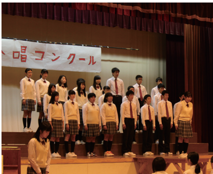
▲ 9月30日 今金中学校 文化祭