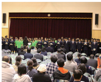
▲ 11月17日 今金高等養護学校 フレンドリーライブ2018